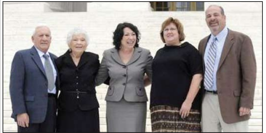
La jueza hispana Sonia Sotomayor posó frente a las escalinatas del Tribunal Supremo y después con sus familiares más allegados: su padraastro, su madre, cuñada y su hermano.