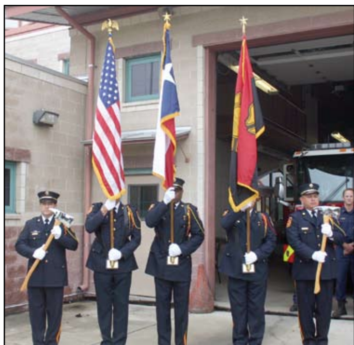
A colorguard performs in front of a local fire station while the national anthem is sung. This was one of many local events commemorating 9/11.