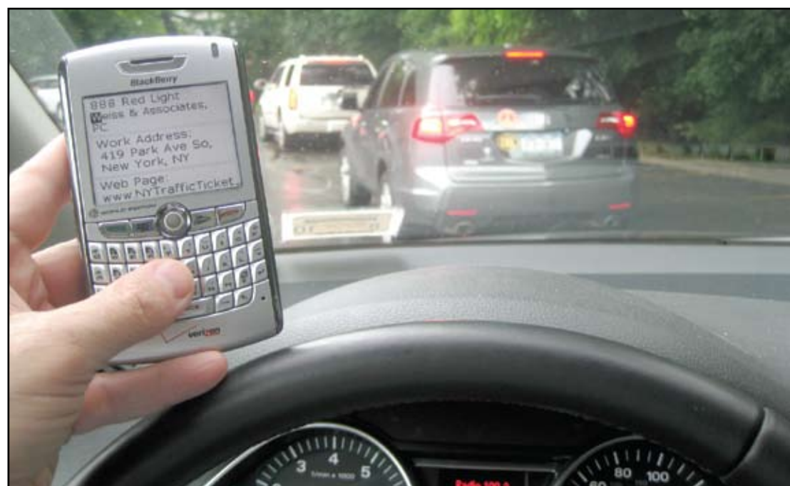
En Estados Unidos ya son 18 estados en los que se han aprobado leyes (algunas aún no entran en vigor) para prohibir por completo los mensajes de texto al conducir